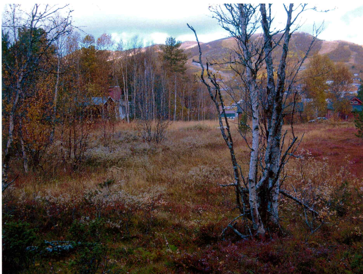
Figur 2: Foto av nordre del av planområdet, tatt mot nord.

Det ble sett etter synlige kulturminner på overflaten i i området og da spesielt etter kullgroper og jernvinneanlegg. Det ble ikke gjort funn av automatisk fredete kulturminner. Ingen nyere tids kulturminner ble registrert innenfor det planlagte utbyggingsområdet.