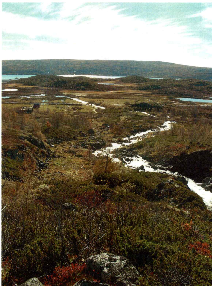
Figur 2: Foto av det planlagte byggeområde for kraftverket ved Øyneåne, sett mot sør.

Det ble sett etter synlige kulturminner på overflaten i området. Det ble ikke gjort funn av automatisk fredete kulturminner langs elva. Ingen nyere tids kulturminner ble registrert innenfor det planlagte utbyggingsområdet.