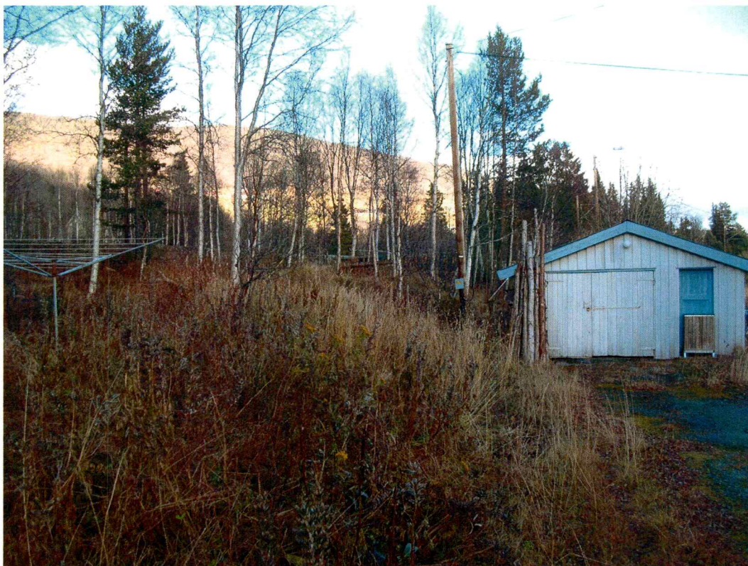
Figur 2: Foto av planområdet i sør på eiendommen 59/77, sett mot nordøst.

Det ble sett etter synlige kulturminner på overflaten innenfor planområdet og da spesielt etter kullgroper og jernvinneanlegg. Det ble ikke gjort funn av automatisk fredete kulturminner. Ingen nyere tids kulturminner registrert.