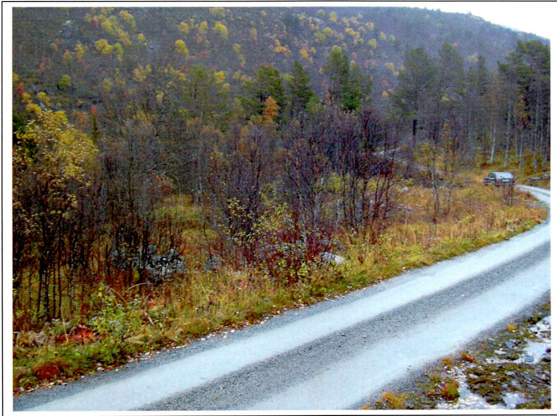
Figur 1: X1 i forgrunnen til venstre, X2 til høyre for X1 og X3 ligger i skråningen til venstre for bilen.