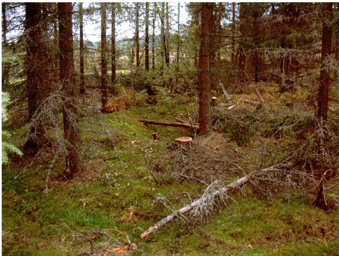
Figur 3: Kullgrop 1, sett mot mot øst.

Det ble sett etter synlige kulturminner på overflaten i skogen sør i området hvor det ikke er utbygd. To kullgroper ble funnet, kullgrop 1 og 2. Disse er avmerket på kartet (figur 2).