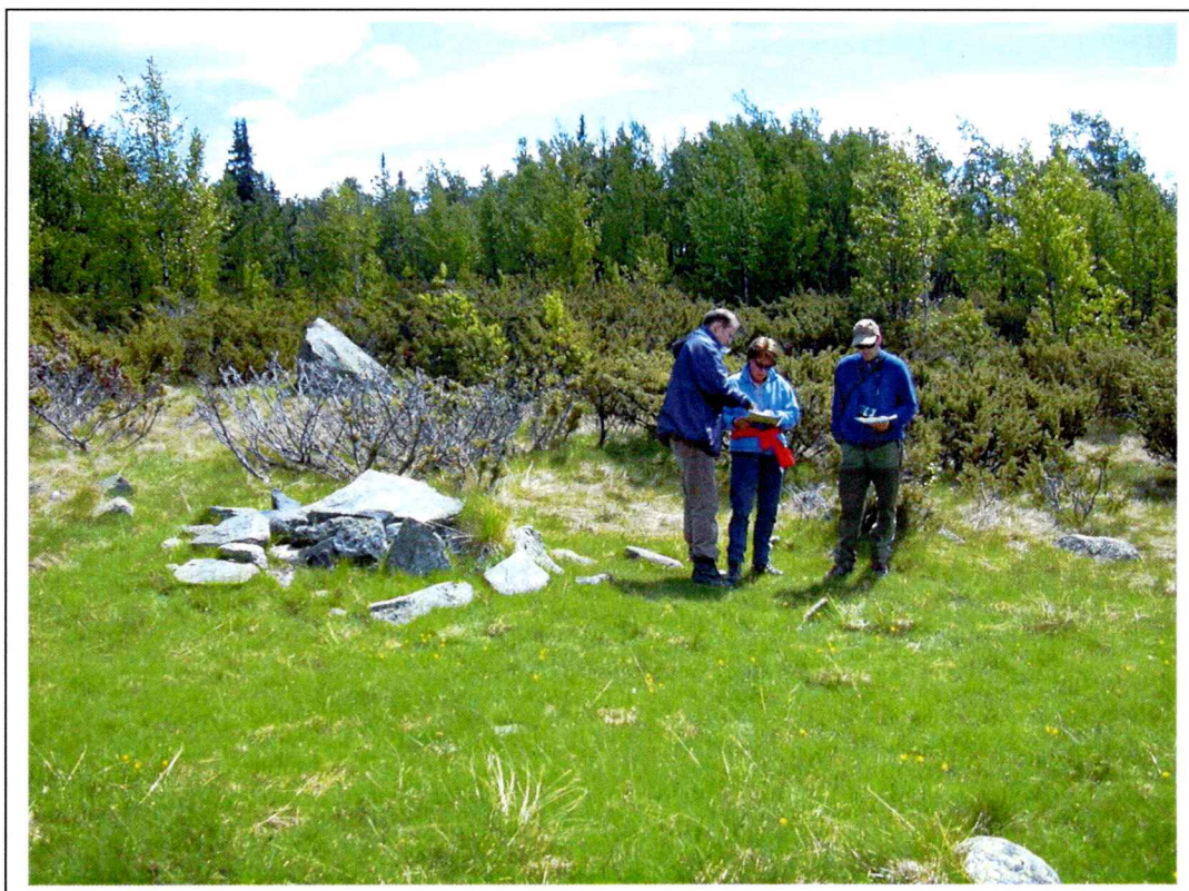
Figur 1: Dørhelle på gammel stølsvoll, tatt mot sørøst.