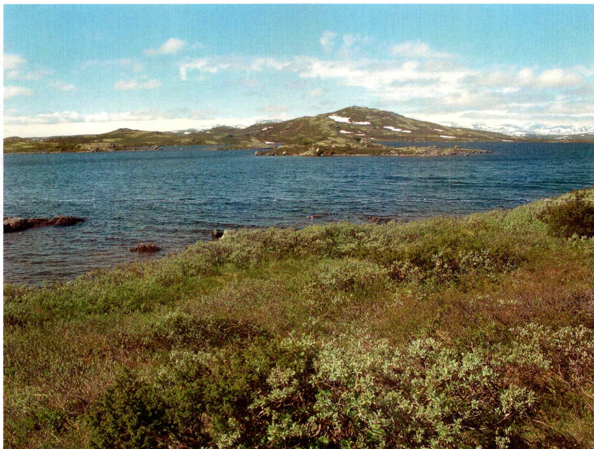
Figur 2: Foto av nausttufttomt ved Bergsjø. Sett mot sørvest.

Ingen kulturminner ble registrert ved nausttufttomta. De tidligere registrerte tuftene ligger et godt stykke unna og kommer ikke i konflikt med reguleringsplanen.