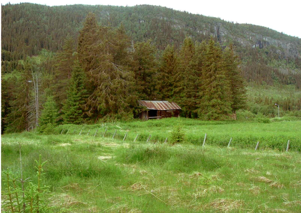
Løe vest i planområdet