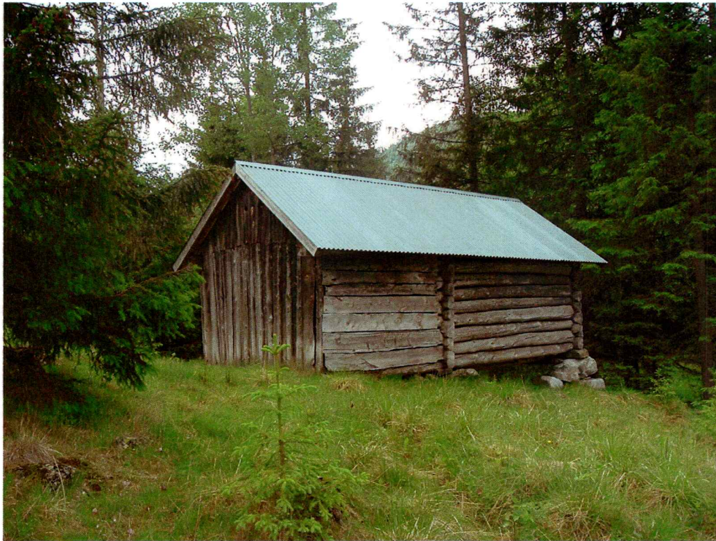
Løe øst i planområdet

Mye av området har en gang vært slått og/eller beitet. Litt av området er også oppdyrket myr. Det ble funnet ruiner etter en husmannsplass og dessuten to stående løer. Det ble også funnet ei stor, moderne rydningsrøys nedenfor vegen..