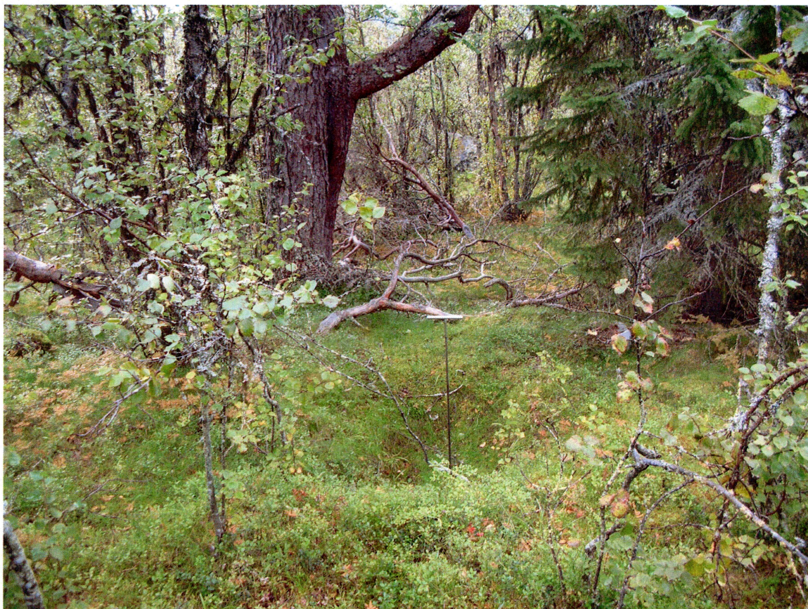
Figur 6: Kullgrop 24, sett mot sør.