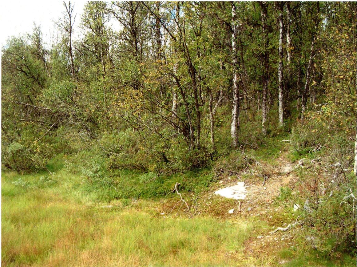
Figur 4: Jernvinneanlegg, sett mot nordvest.