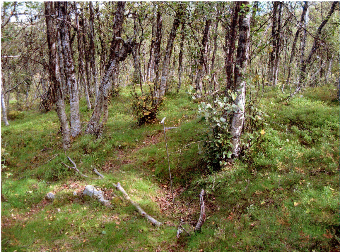
Figur 5: Kullgrop 8, sett mot nordøst.