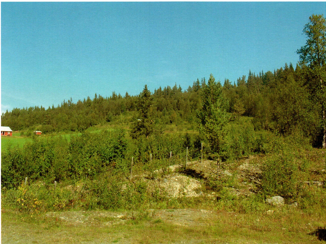
3: Oversiktsfoto av området øst for Pålset med stølsområde til venstre, sett mot nordøst.