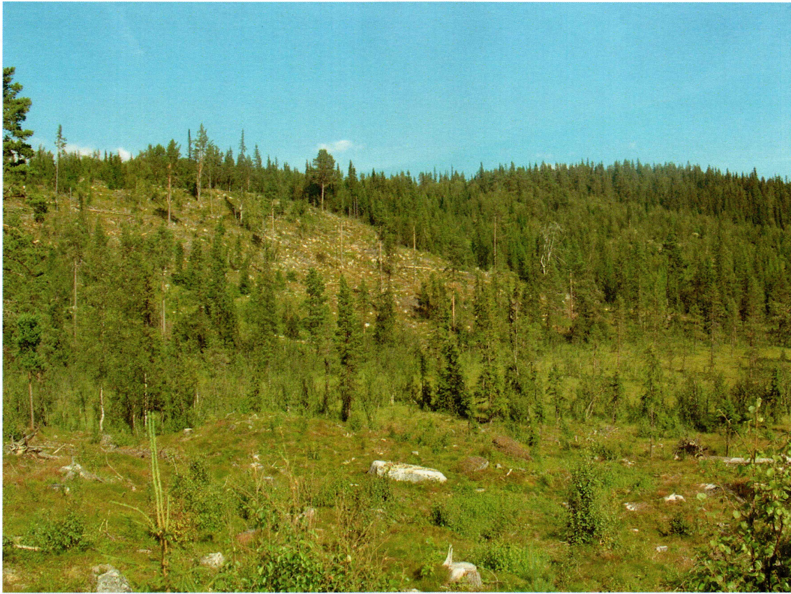
Figur 2: Oversiktsfoto av området lengst øst, sør for Hjallestølen, sett mot nordøst.