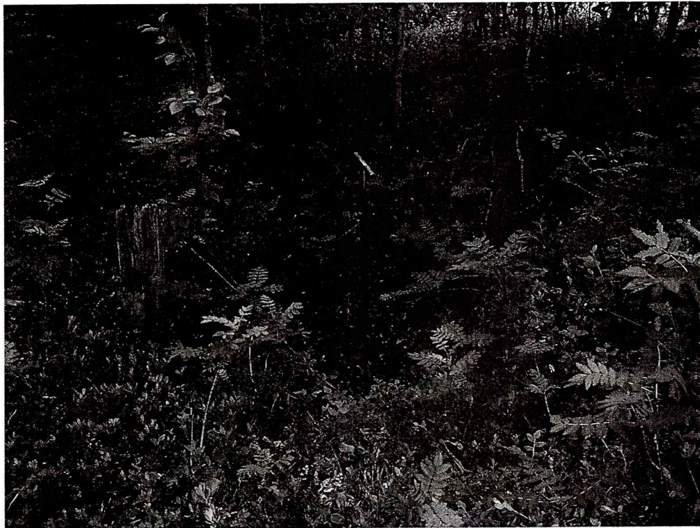
Figur: Foto av kullgrop. Sett mot NØ.

Dyregraven ligger på en N-S-gående åsrygg, 11 m N for veien og 3 m Ø for en gammel kjerrevei. Området er hogd for skog og det vokser noen små løvtrær på stedet. Terrenget faller mot NNV. Grava har rektangulær form og ligger i retning Ø-V. Den er trolig gjenfylt. Den markante formen og de synlige steinene i kantene taler for at det har vært en fangstgrav.