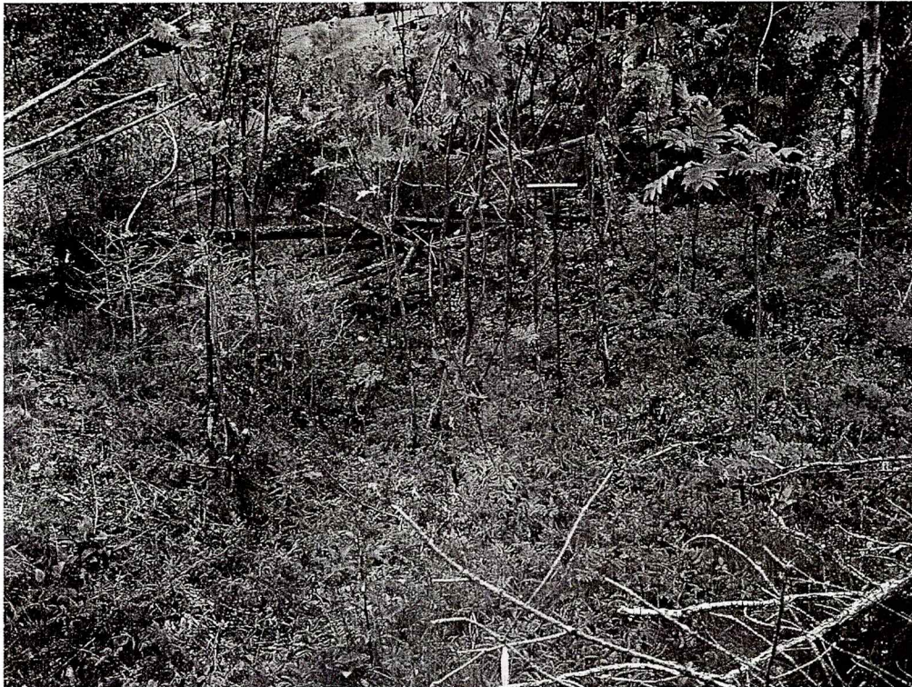
Figur: Foto av fangstgrav. Sett mot ØSØ.