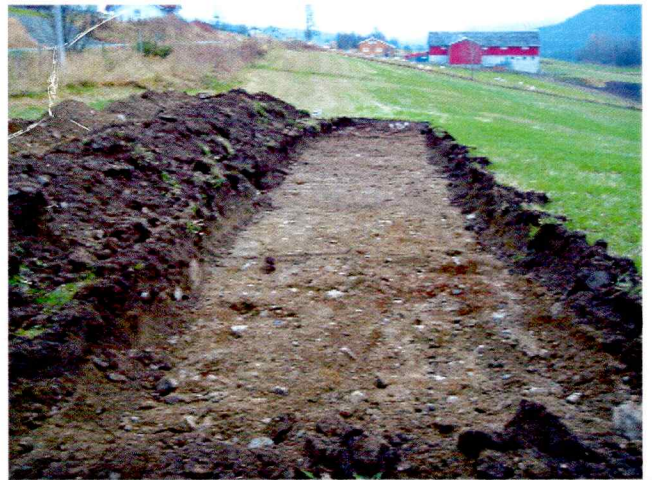
Sjakt 1 mot Torset søre ( mot øst).