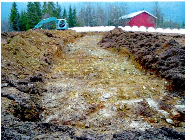
Sjakt 4 mot sør.

I innmark på Torset nordre ble det gravd 5 sjakter ved hjelp av gravemaskin for å avdekke eventuelle spor uten synlig markering på overflaten.