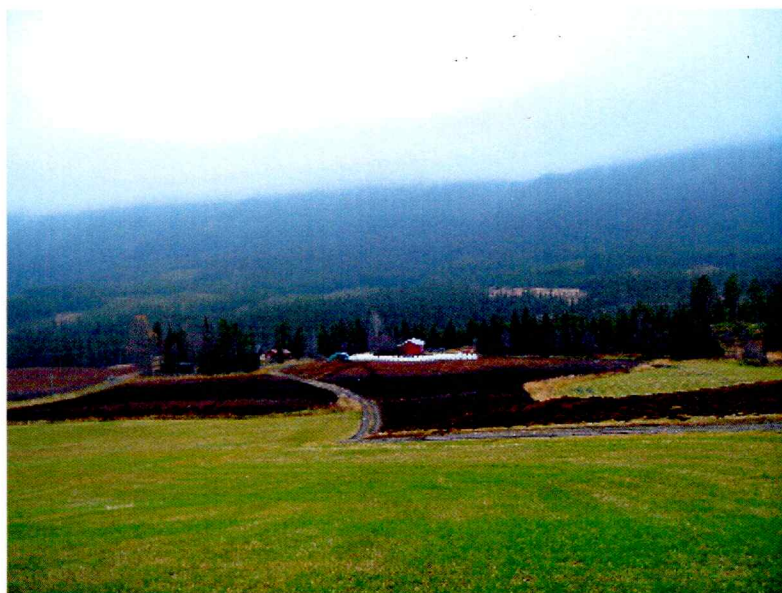
Oversiktsbilde over undersøkelsesområdet, fra sjakt 1 mot sør.

Fra fylkesvei 233 og ned til hytte/fritidsbolig på Gnr./B.nr 61/23 følger planområdet eksisterende veitrase med utvidelse mot vest på åker/ dyrket mark, samt et lite område ved fylkesveien. Øst for 6/23 og 6/54 og sør mot Dyrja går traseen gjennom et område med påfylt masse i forbindelse med redskapsskjul og et skogbelte av granskog med ryddet trasee for høgspentlinje.