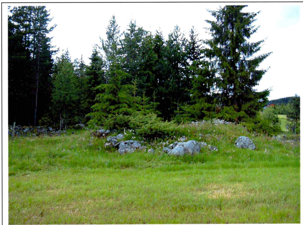
Figur 1: Tuft X5 og steinstreng X4 i bakgrunnen til venstre, tatt mot nordvest.