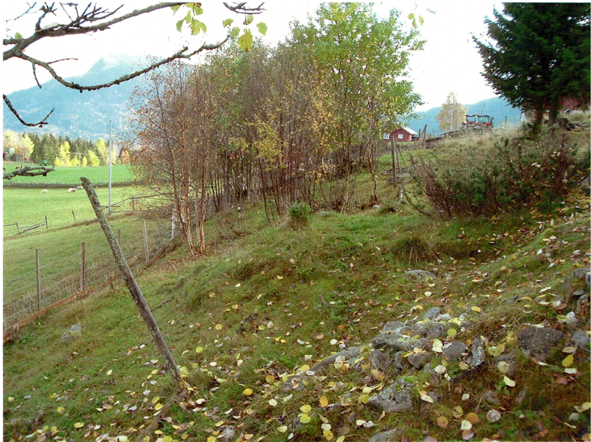
Foto: Gravhaugen sett mot sør, lita røys nærmest.