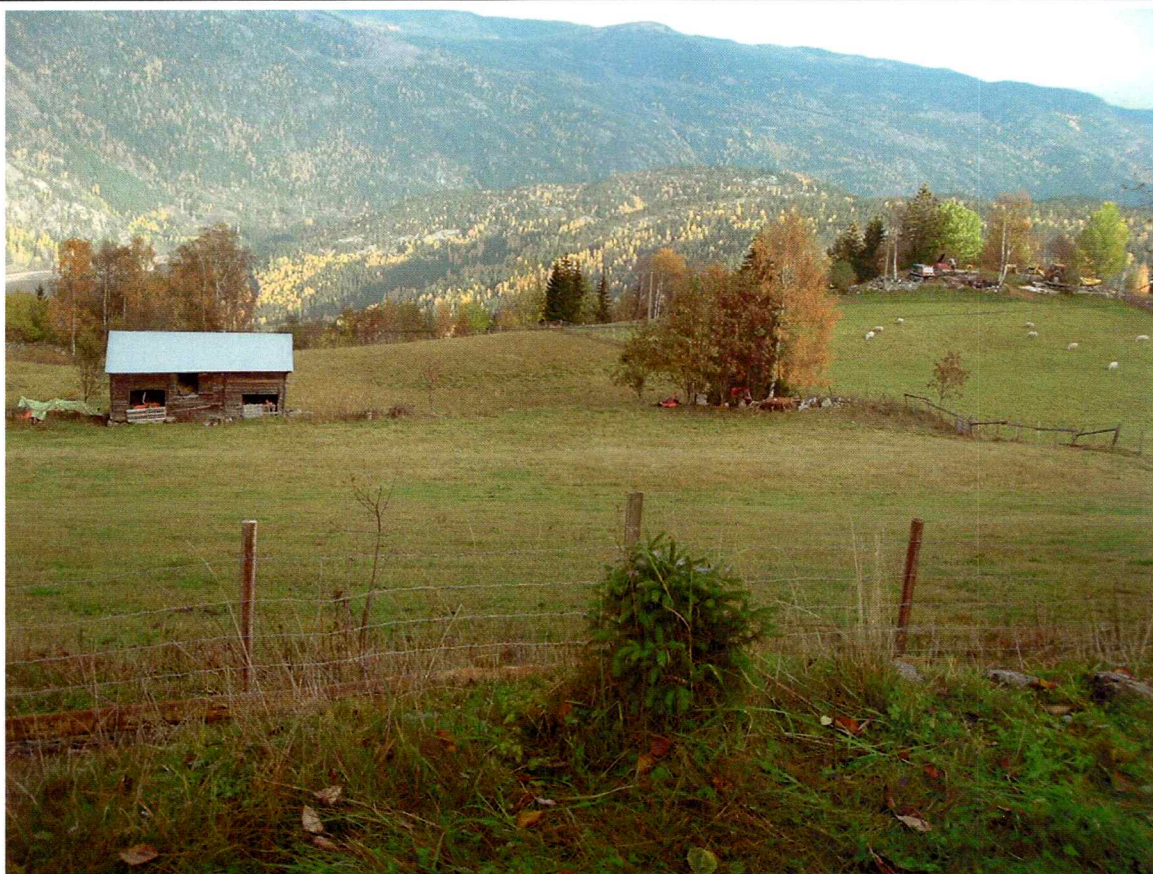
Foto: Utsikt fra gravhaugen mot øst.

Eieren av Brenno 98/2 har ved tidligere anledning meldt fra til Oldsaksamlingen om funn av en gravhaug på jordet sitt, men funnet har ikke tidligere blitt kartfestet. Funnet ble fotografert og kartfestet samtidig med befaring av en landbruksvei og traktorvei ved gården 17.10.06., men denne graven ligger ikke i et område som blir berørt av noen av tiltakene.