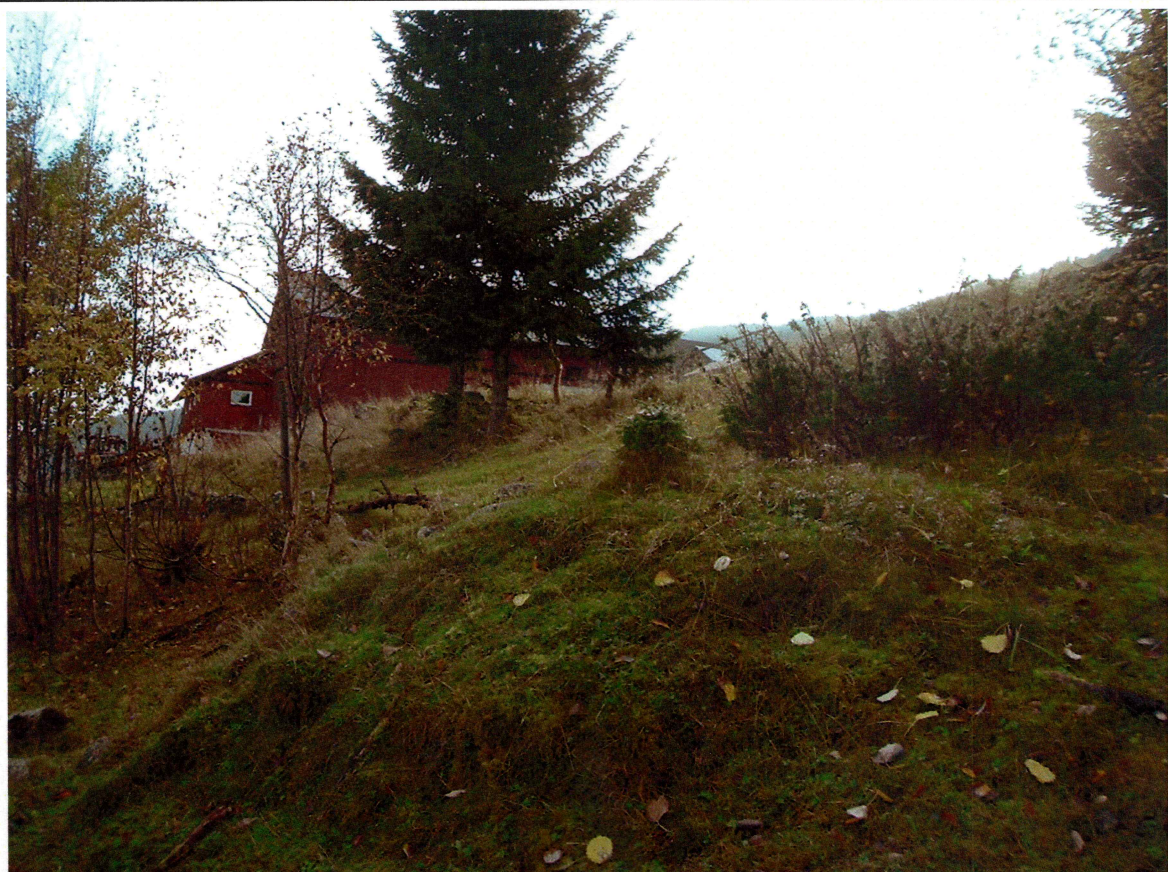
Foto: Haugen sett fra øst mot vest.