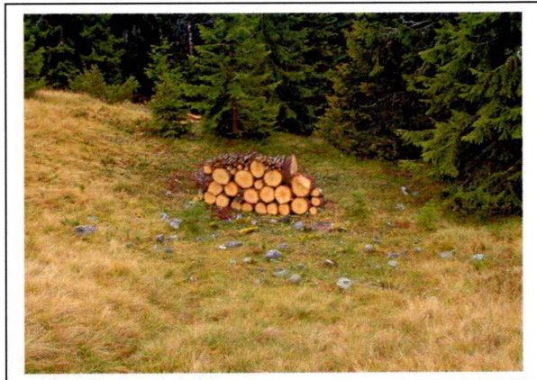
Figur 1: X1, sett mot sør.

Ligger rett øst for hytte på setervollen, i en liten søkk i terrenget. Merkelig plassering for en rydningsrøys, kan være en tuft eller lignende. Måler 3.50 x 3.00 m, bestående av steiner med diameter 0.15 – 0.30 m som ligger tettpakket. Har en kvadratisk eller sirkulær form, med enkelte større steiner. Høyde 0.10 – 0.20 m. Ellers på setervollen nesten ikke synlig stein. GPS innmåling: 9 m avvik N 60 29.997 Ø 009 04.972