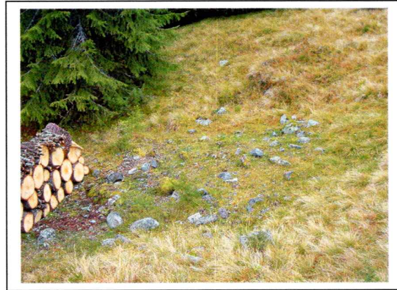
Figur 2: X1, sett mot vest.