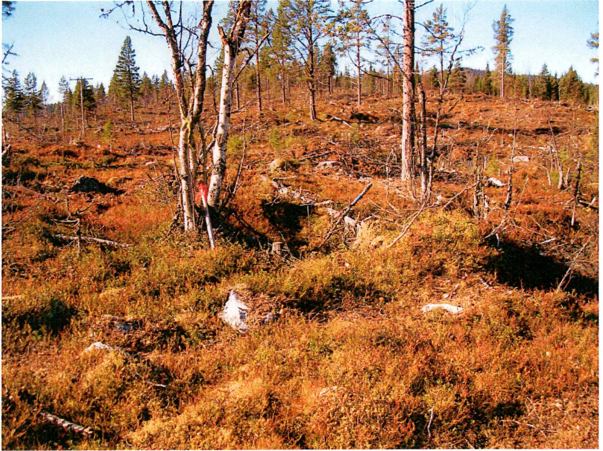
Figur 3: Foto av fangstgrop R1, sett mot vest.