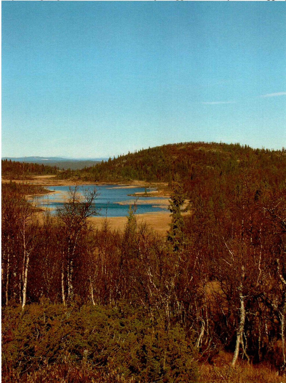
Figur 2: Foto av traseen, sett mot nord.

Området ligger ca 4,5 km fra avkjørselen mot Jordeslia i Rukkedalen, nordvest for Nesbyen. Traseen strekker seg 1,7 km fra Bostjernlia i nord til Bardalhytta i sør. Den går i nord i åpent, flatt terreng på østsiden av en nord-sør gående myr. Siden fortsetter den sørover langs østre side av vannet Bostjern, før den går videre i stigende skogsterreng mot Bardalhytta. Det er en jevn stigning fra 1020 m.o.h. ved Bostjern opp til Bardalhytta som ligger på 1060 m.o.h.