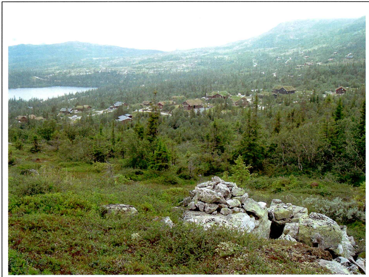
Foto: Damtjernihallin, Damtjern og registrert røys i forgrunnen (X1).