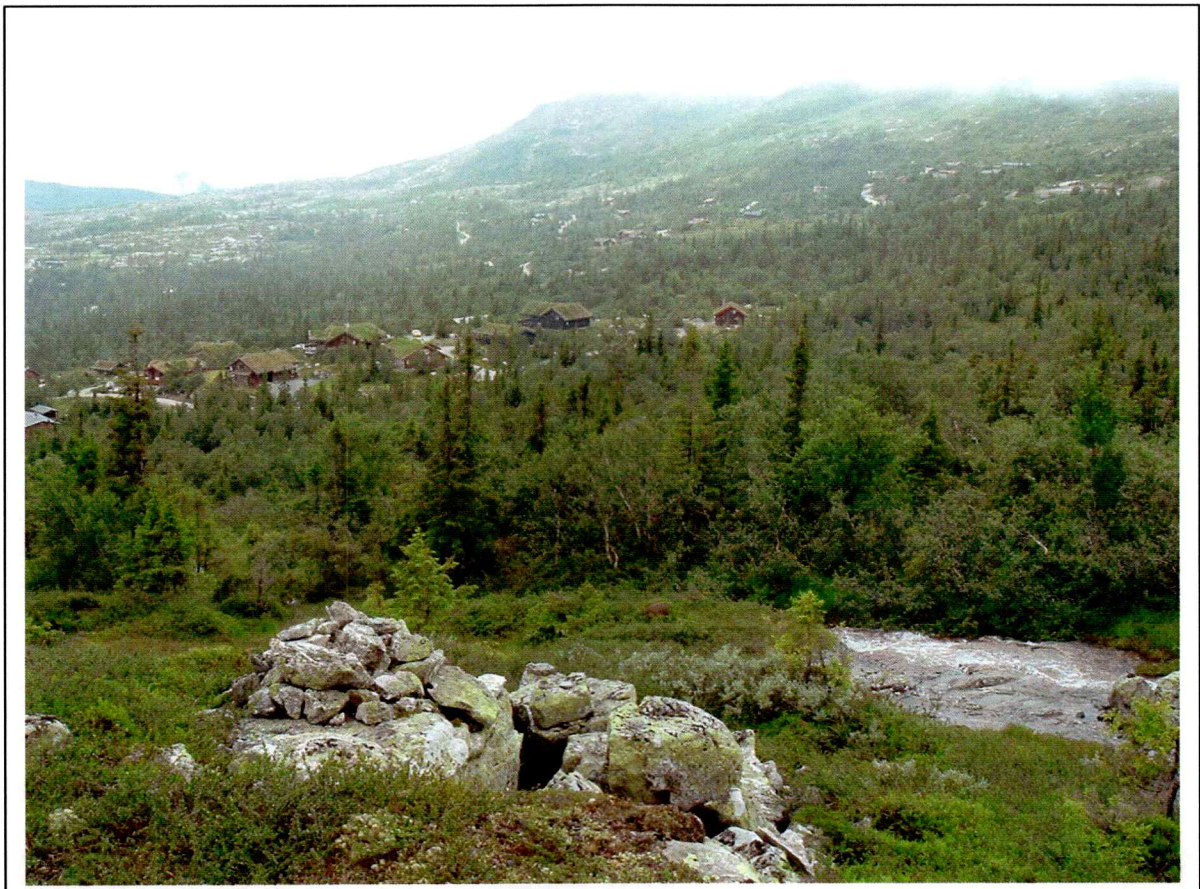
X1 fra nord mot sør.