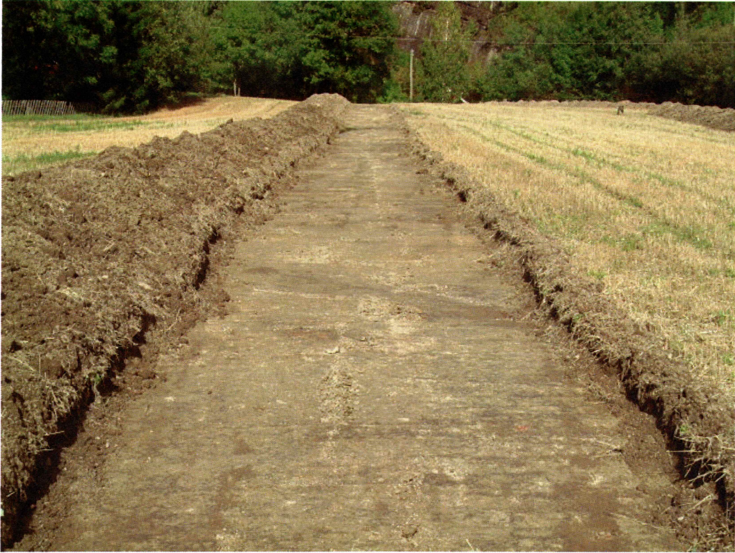
Sjakt 3 (mot NØ)