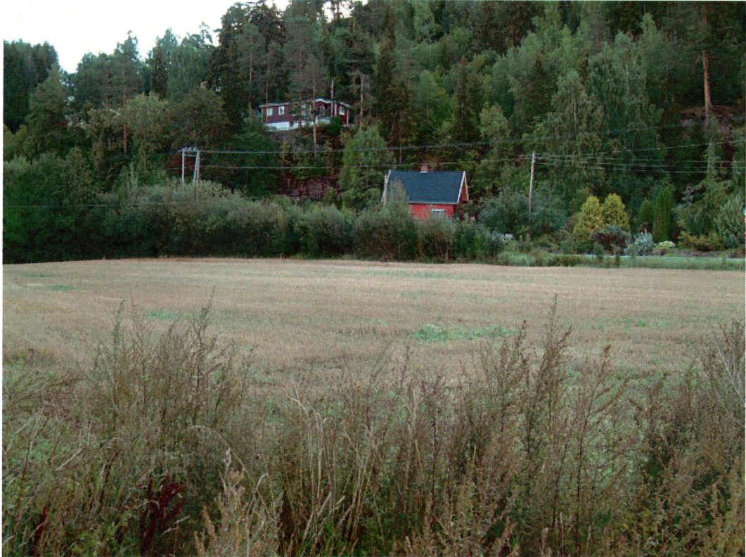
Oversikt over planområdet (mot NØ)