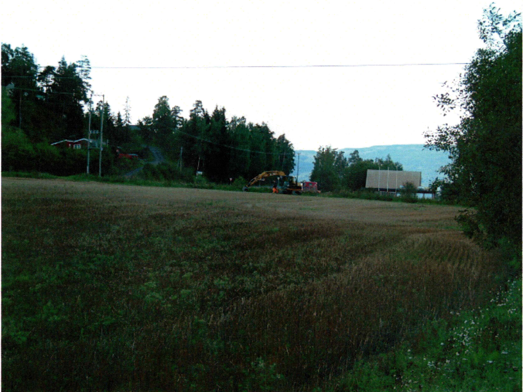
Oversikt over planområdet (mot S)