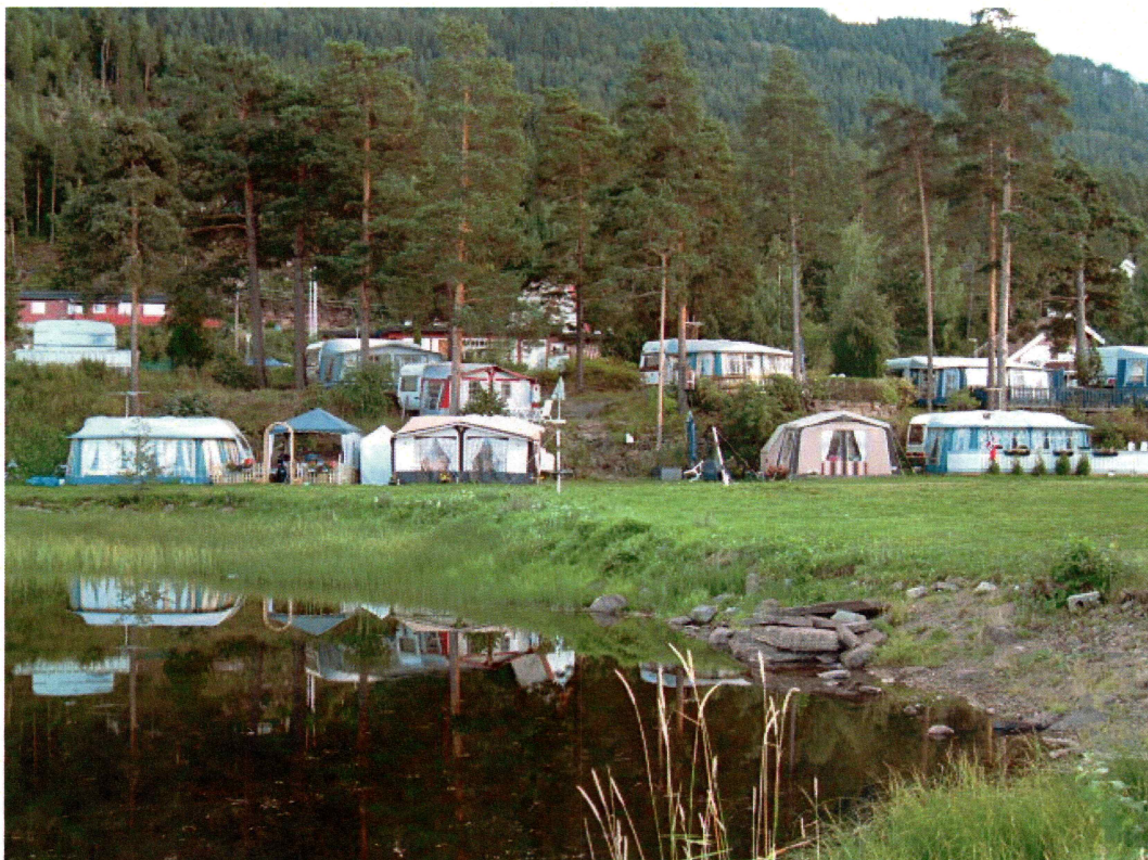
Oversiktbilder av planområdet, Tyrifjord camping (mot SØ)