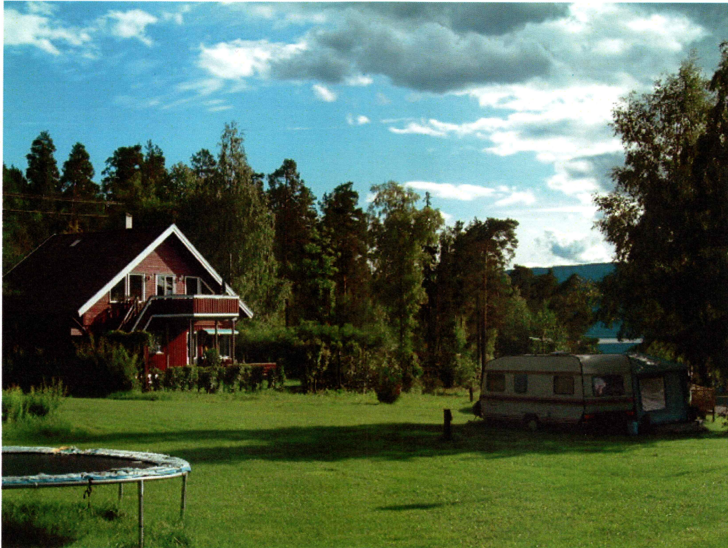
Oversiktbilder av planområdet, Tyrifjord camping (mot SSØ)