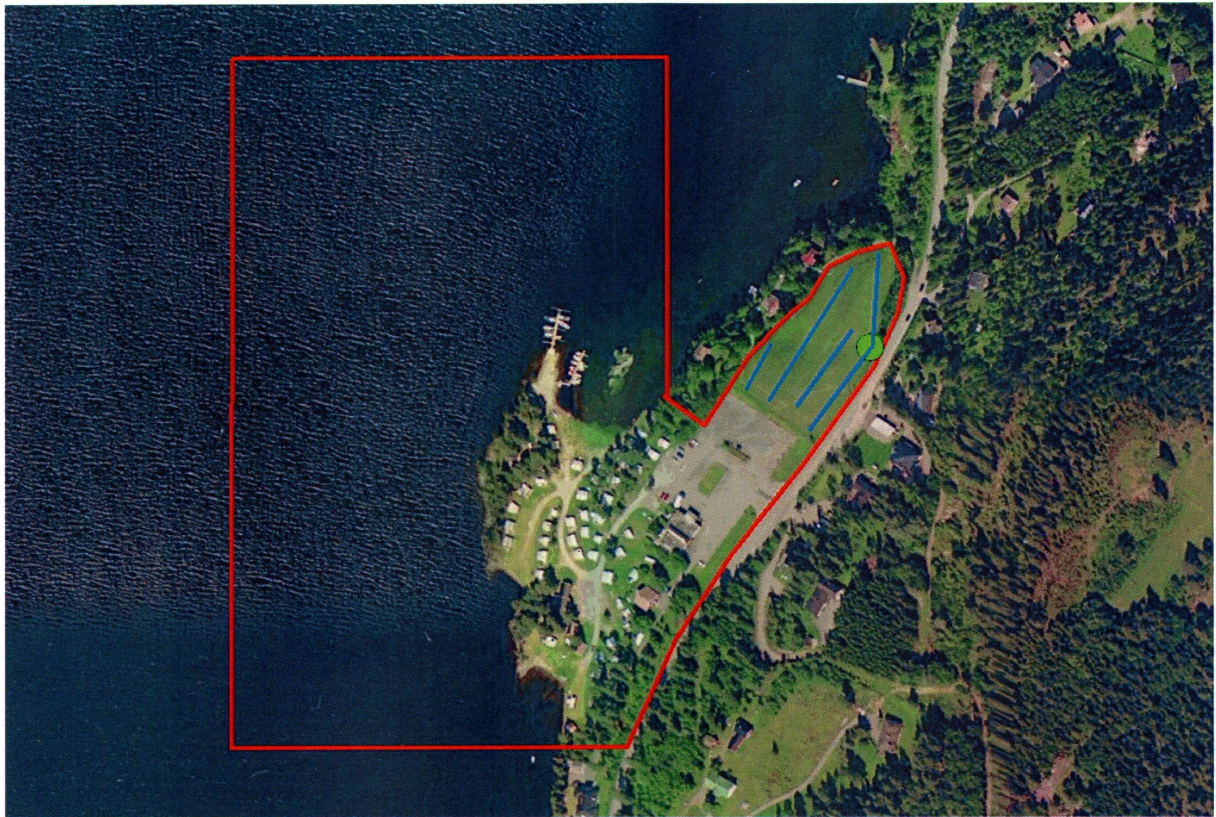
Satelittfoto over planområdet