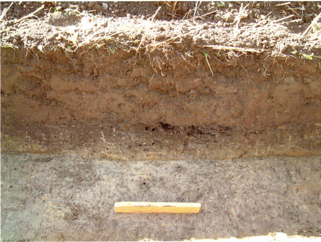
Dyrkingslag med mye kull, sjakt 1 (mot V)