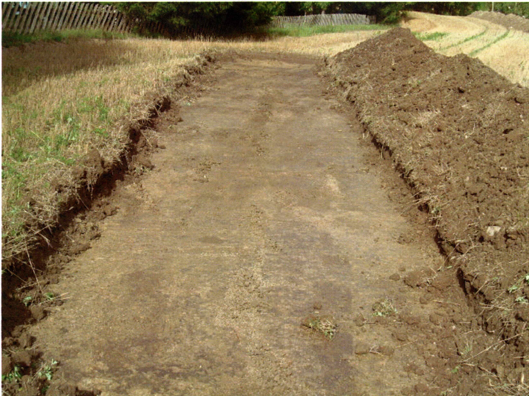
Sjakt 4 (mot NØ)