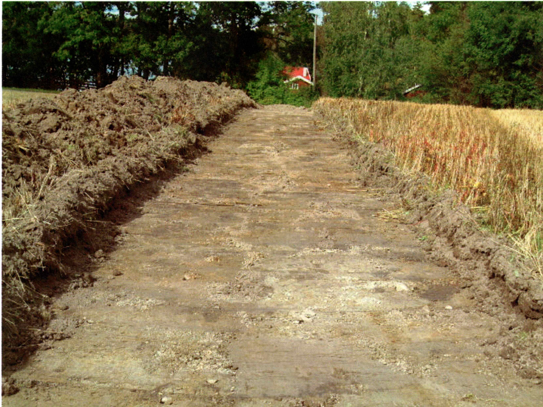
Sjakt 1, nordre del (mot N)