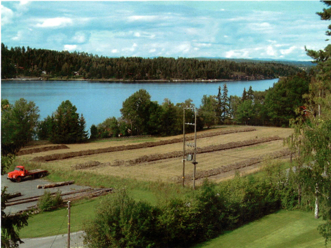
Oversikt over planområdet, ferdig sjaktet (mot N)