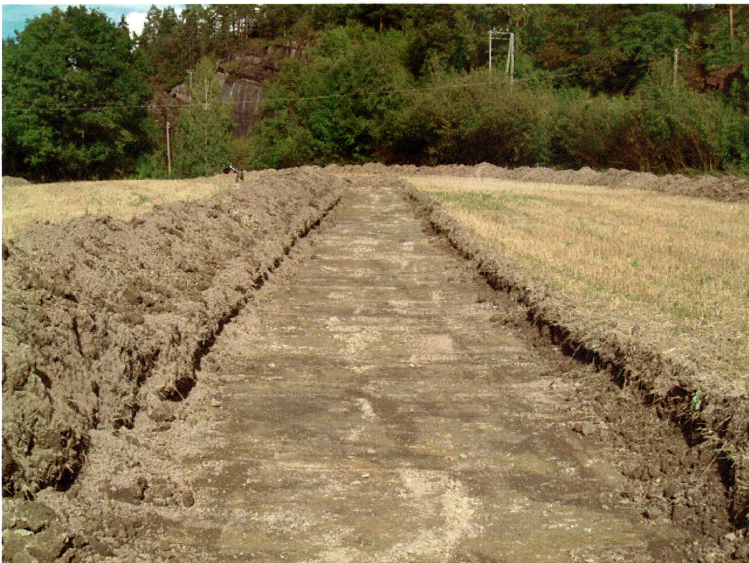
Sjakt 2 (mot NØ)