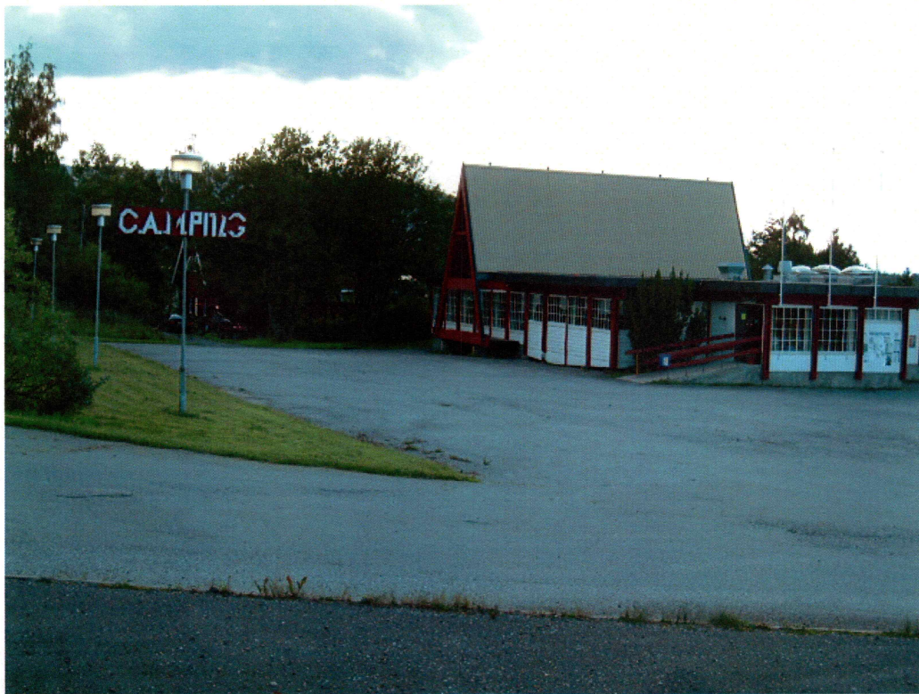
Tyrifjorden camping (mot SV)