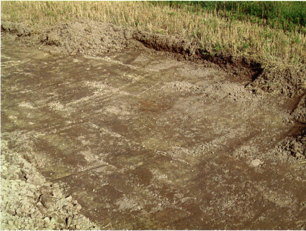
Utvidelse sjakt 1 (mot V)