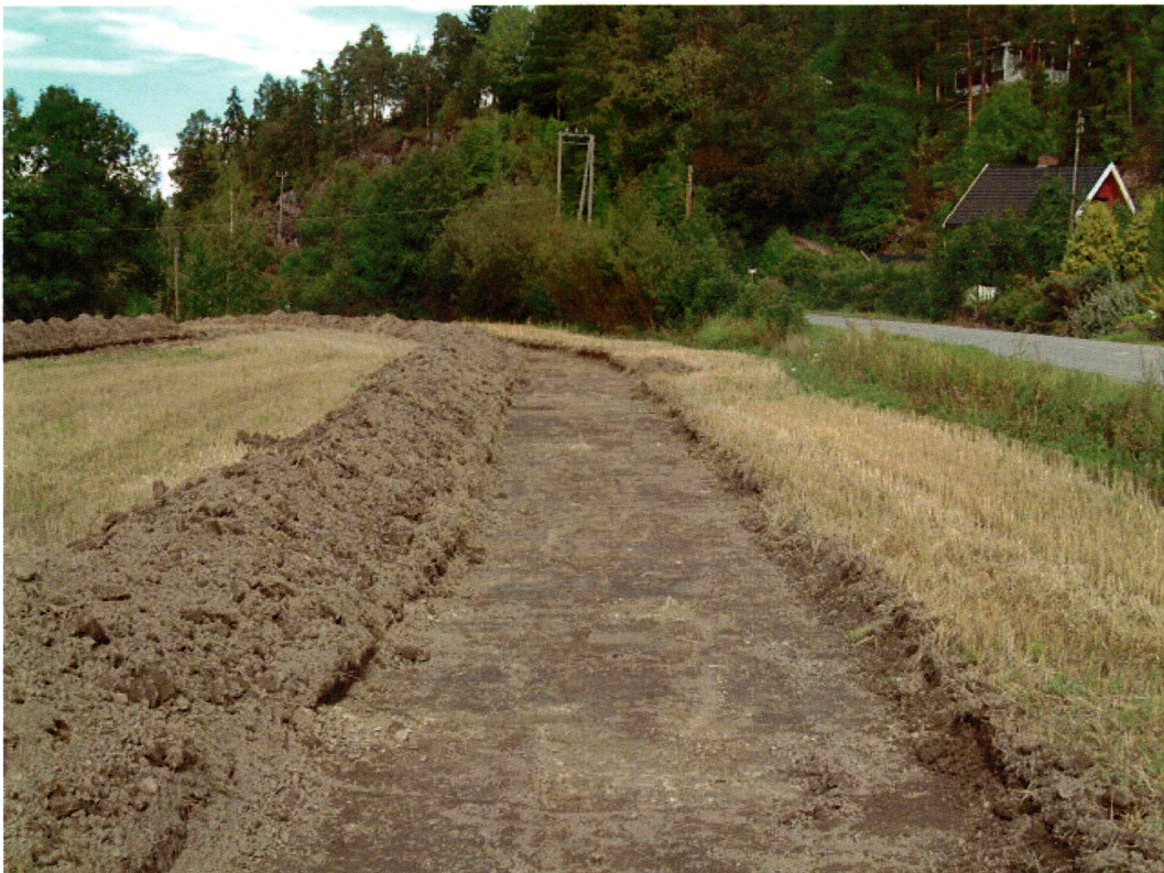
Sjakt 1, søndre del (mot NØ)