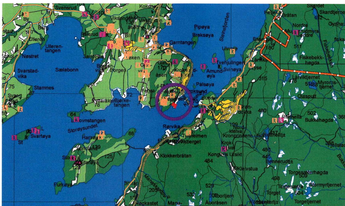
Planområdet innteikna på N50-kart.

Føremålet med registreringa er å undersøke om planområdet kjem i konflikt med eventuelle automatisk freda kulturminne, jfr. § 9 i kulturminnelova av 9. juni 1978.