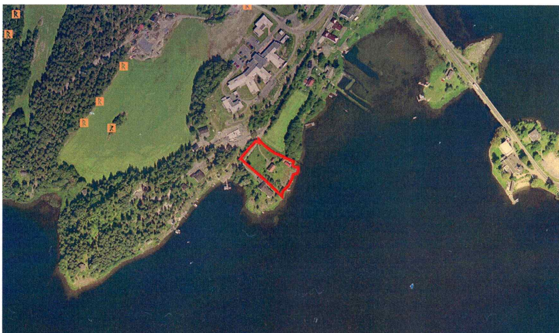
Planområdet innteikna på ortofoto.