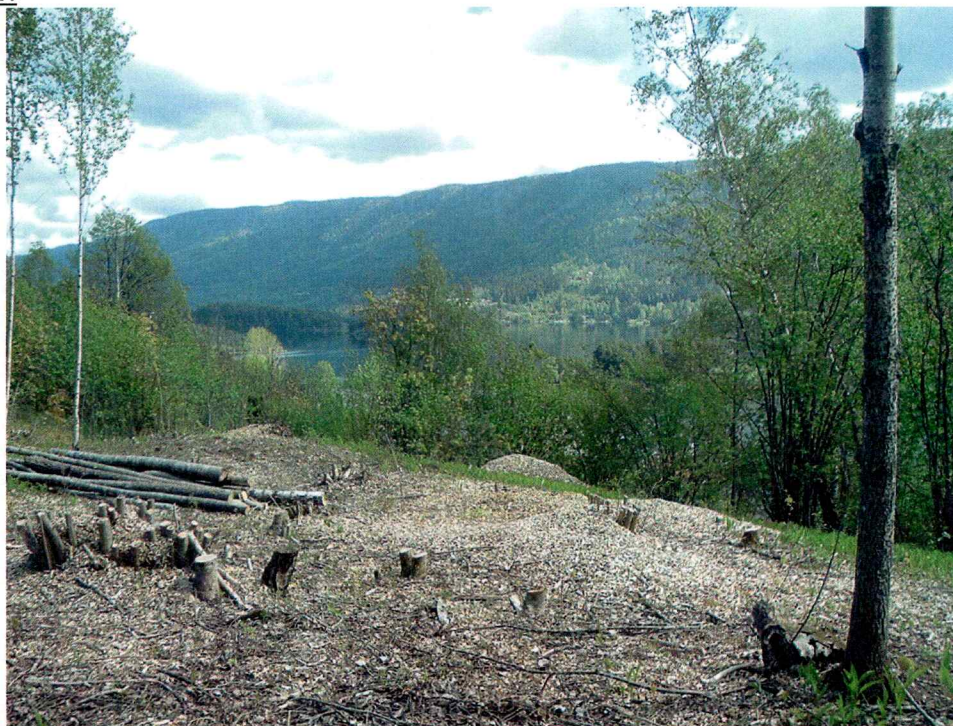
Område 1, bilde tatt mot NØ

Område 1 er på ei flate som heller svakt mot Ø i den nordre enden av den N-S-gående åsryggen som utgjør planområdet. Det er god utsikt mot Tyrifjorden i Ø. Området er nylig blitt renhøgd, men det var mye røtter i grunnen. Høyden er ca. 90 moh. Grunnfjellet bryter stedvis frem i dagen.