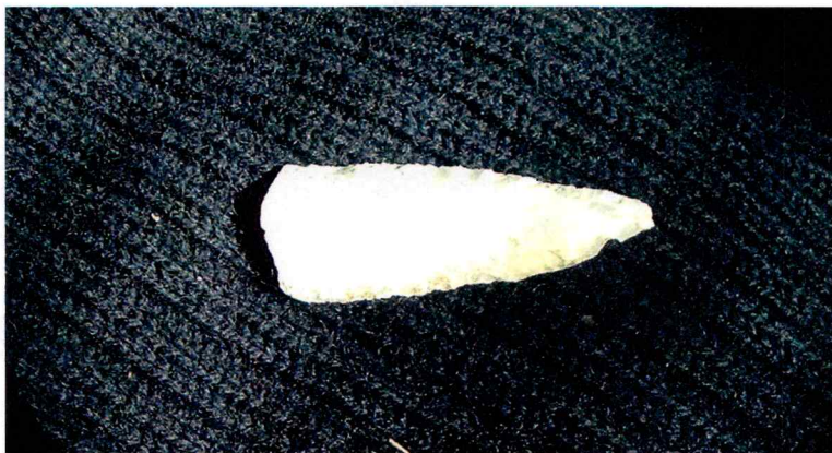
Flintspiss fra lok.107086