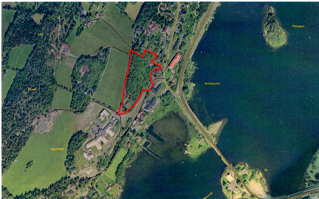
Ortofoto over planområdet.

Planområdet består av en NNØ-SSV-orientert åsrygg. NØ og S i planområdet er det boligbebyggelse. Det er god utsikt mot Kroksund og Steinsfjorden fra store deler av planområdet. Terrenget heller sterkt mot både Ø og V, men er brattest i Ø. Det heller også noe mot S. Planområdet ligger 80 til litt over 100 moh. I NV var skogen på en del av planområdet nylig hogd ned, mens resten av området var tett bevokst med løvskog, enkelte grantrær og kratt. Langs V-siden av åsryggen går det en sti, mens en annen sti krysser planområdet i N.