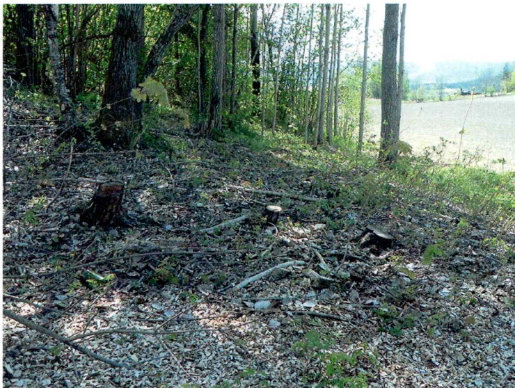
Område 2, bilde tatt mot SSV.

Område 2 besto av en flate nedenfor og V for åsryggen i planområdet. Flaten grenser i V til dyrket mark. Området er nylig hogd, men det er mye røtter i grunnen. Høyden er ca. 90 moh. Det ble gravd tre prøvestikk her. Alle målte ca. 30x30 cm. Det ble ikke gjort funn i prøvestikkene som blir beskrevet under. Lagbeskrivelsen går fra øverst til nederst.