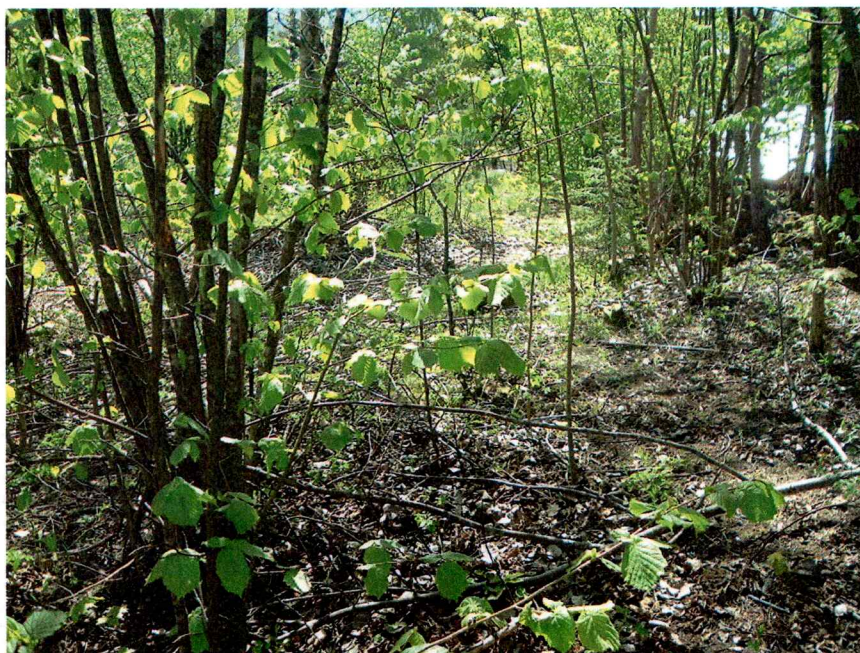
Område 3, bilde tatt mot SSV.