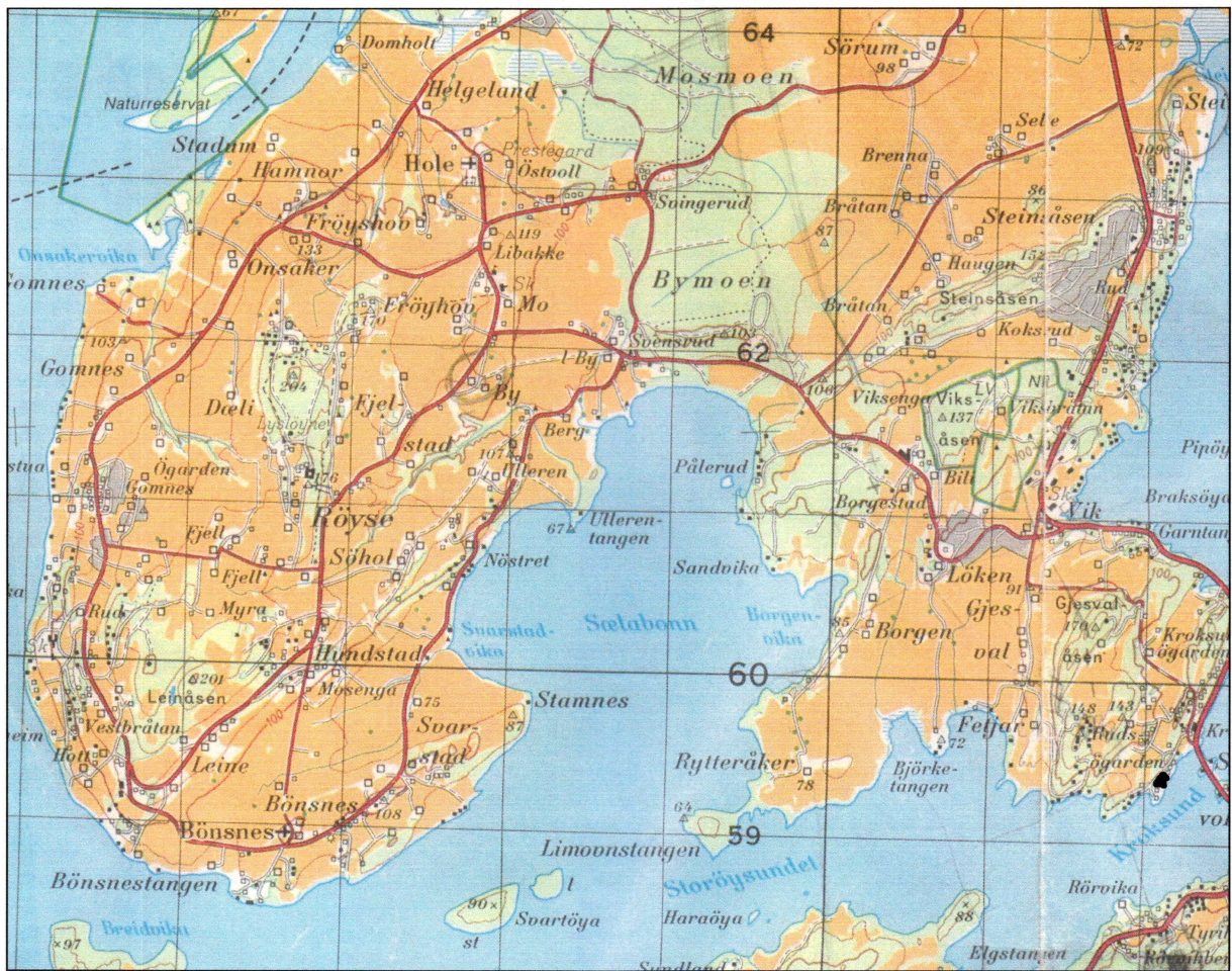
Kart over Rudsødegården/Kroksund.