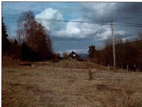
Sjaktene satt på langs av sletten.

Undergrunnen bestod i hovedsak av leire og siltundergrunn, men lengst i sør er det mer sandblandet grunn. Det var her det ble registrert 2 kokegroper. Kokegropene er gitt felles ID-nummer 91636 i Askeladden.