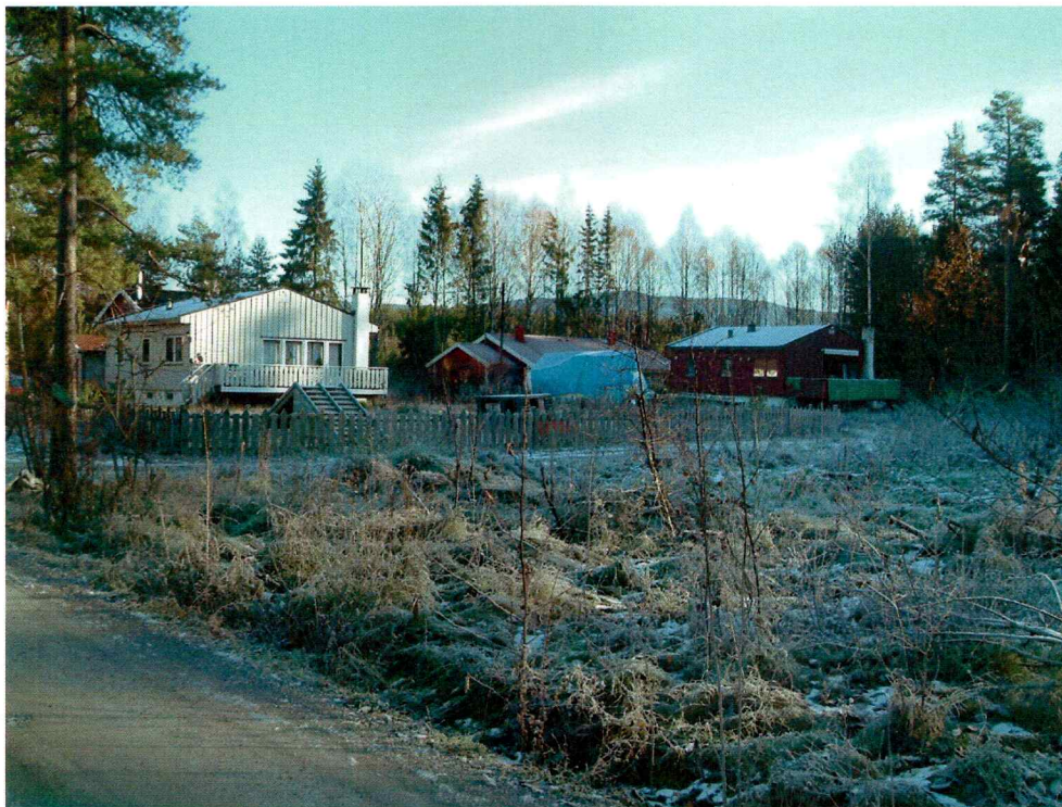
Del av planområdet (mot SØ)