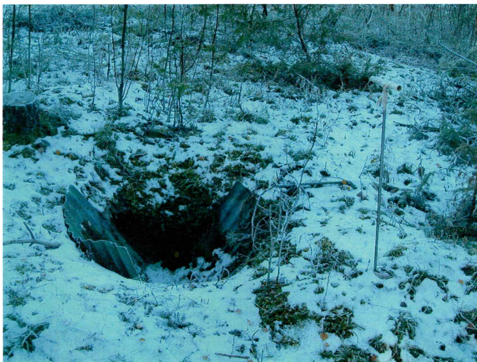
Moderne grop, dekket av bølgeblikk (mot NV)

Området ble innledningsvis overflateregistrert for å påvise automatisk fredete kulturminner. Her ble det funnet en moderne grop, dekket av en bølgeblikkplate. Det var også mye annet moderne avfall som lå spredt rundt på bakken, som jernskrot og bildekk. Det var også gravd ned en kum og flere rør til fremtidige tomter.