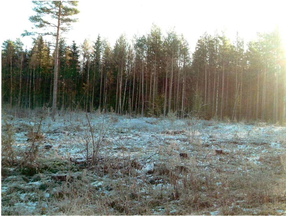
Vegetasjon og landskap i planområdet (mot SØ)

Det er som nevnt ikke registrert automatisk fredete kulturminner innenfor planområdet tidligere, men det er gjort flere funn på nærliggende gårder.