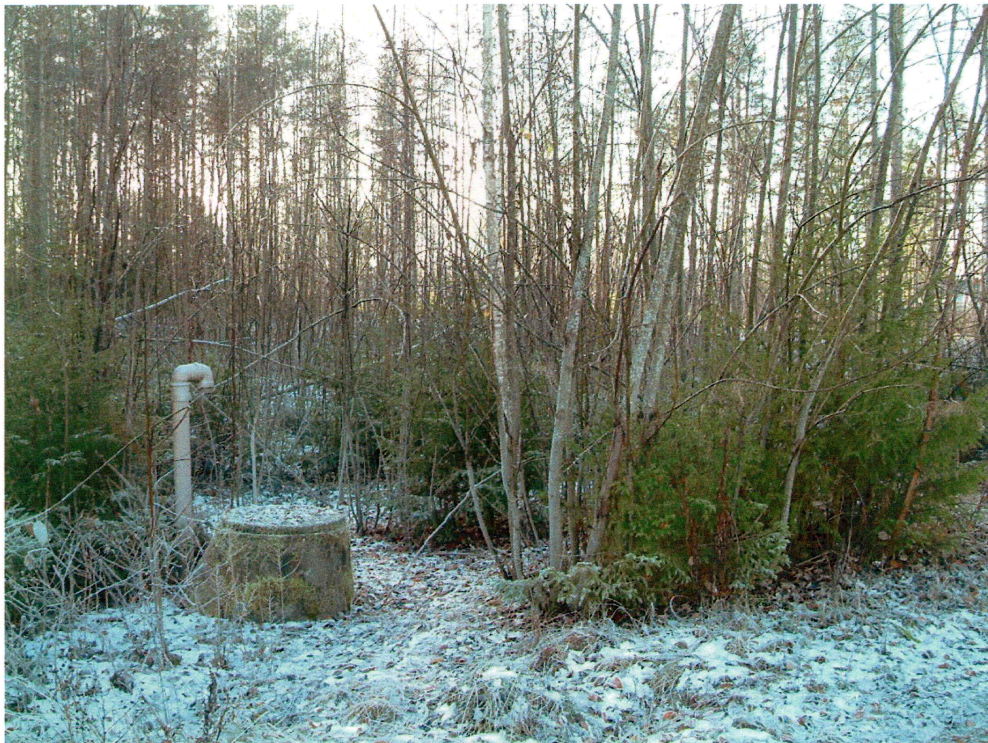
Nedgravd rør og kum i planområdet (mot SV)