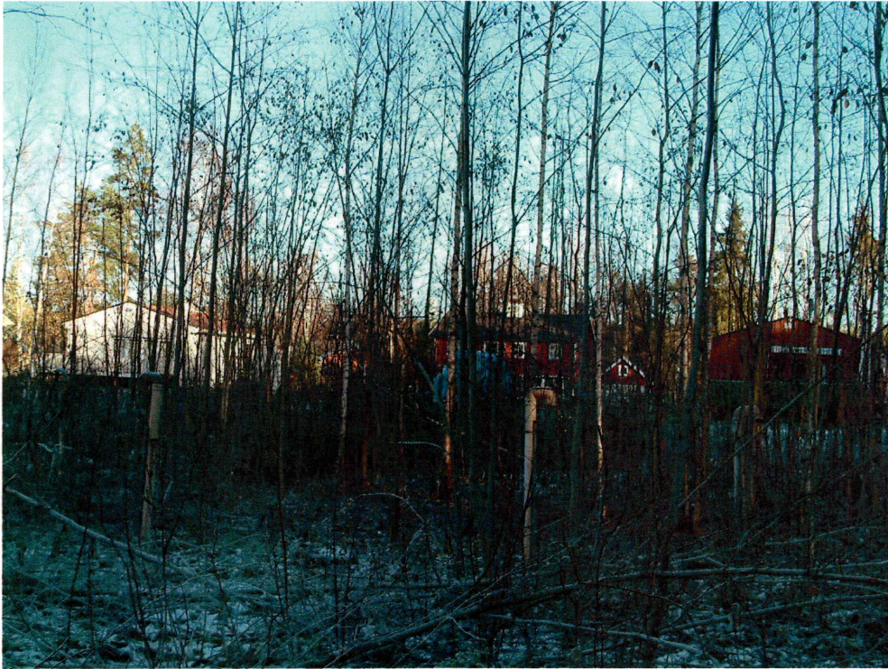
Nedgravde rør i planområdet (mot NØ)