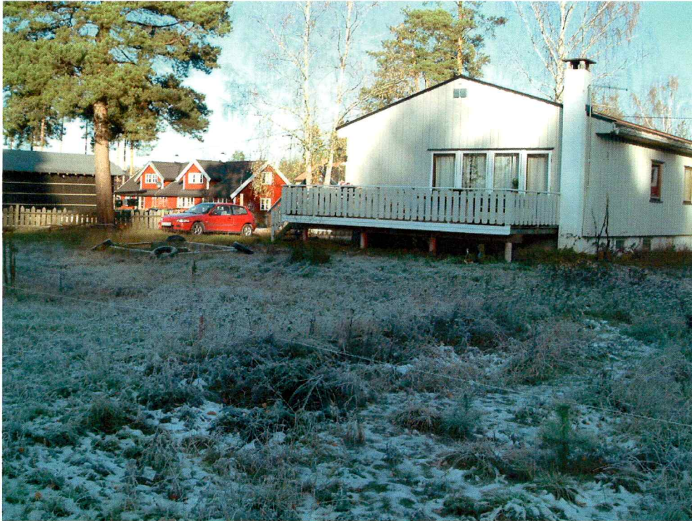
Linjær struktur i det nordligste hageområdet (mot NØ)

Det ligger som nevnt to boligtomter med tilhørende hageanlegg i den østre delen av planområdet. Disse ble bare overflateregistrert. Det ble påvist noen linjære strukturer i det nordligste hageområdet (gbnr 180/130), men disse har sannsynligvis forbindelse med anleggingen av hus og hage.