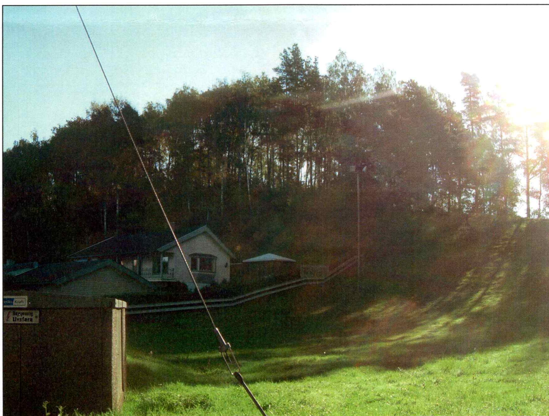
St. Hanshaugen. Bilde tatt mot NØ.