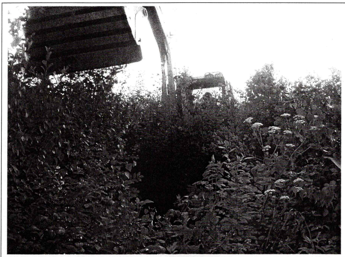
Illustrasjon av vegetasjonens tetthet innenfor planområdet

I øst er området avgrenset av veg, i vest av tilgrensende åker og i nord og syd av bebyggelse.