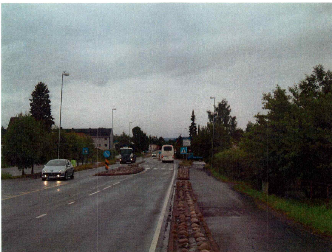
Rv 35 (Hønefoss sentrum) sett frå den nordlege enden av planområdet. Foto mot SSV.