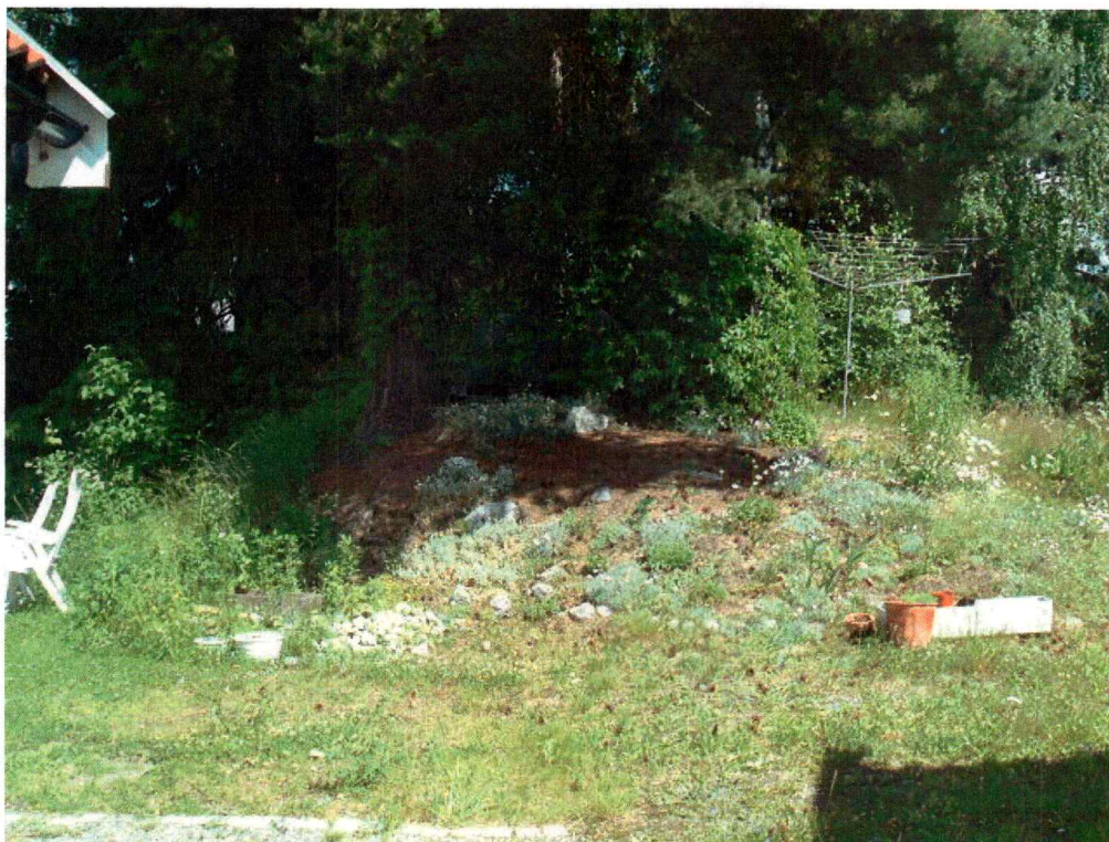
Gravhaug ID 52650. Foto mot aust.

Fleire usikre kulturminne var registrert i området rundt Hovskrysset (nordre avgrensing av planområdet):