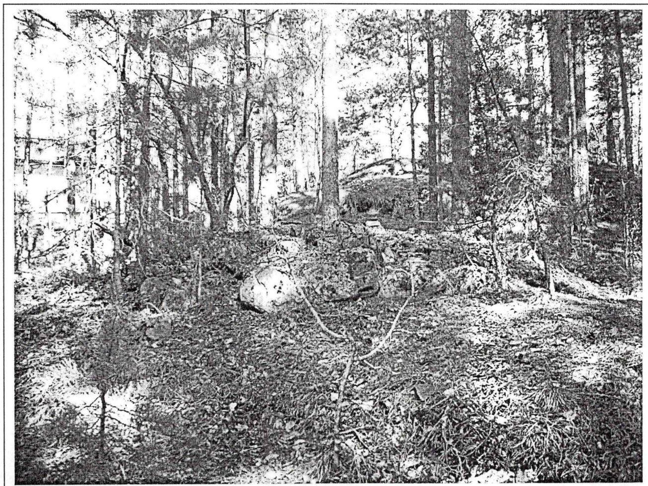
Røys 1 slik den fremsto ved registreringen i 2003