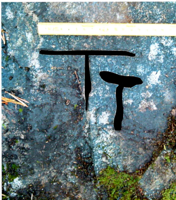
Figur 1. Skissert på fotografiet hvordan ristningen ser ut.