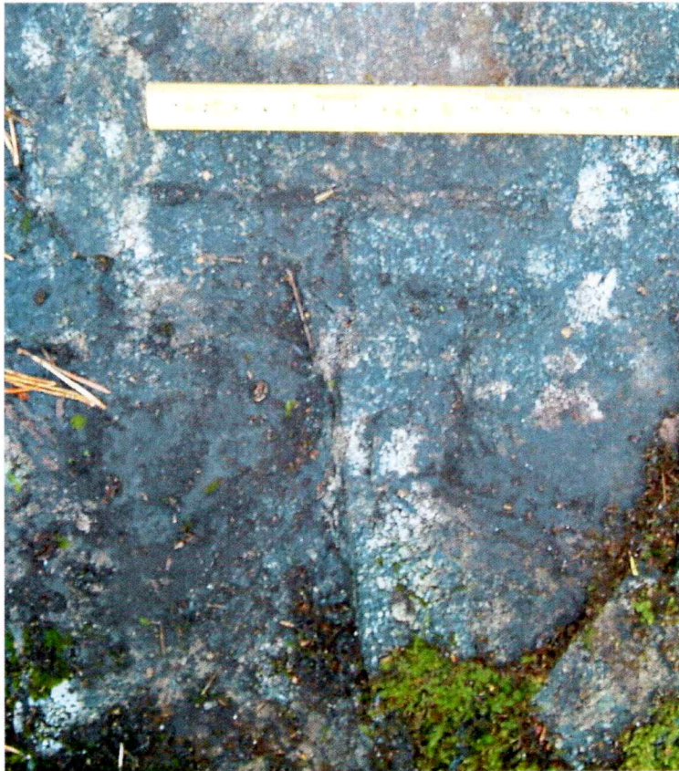
Figur 1. Ristningen på steinen sett ovenfra.

Det er mest nærliggende å tenke at tegnet er et bumerke. Vi har dog ikke gjort noen nærmere studier for å avklare dette.