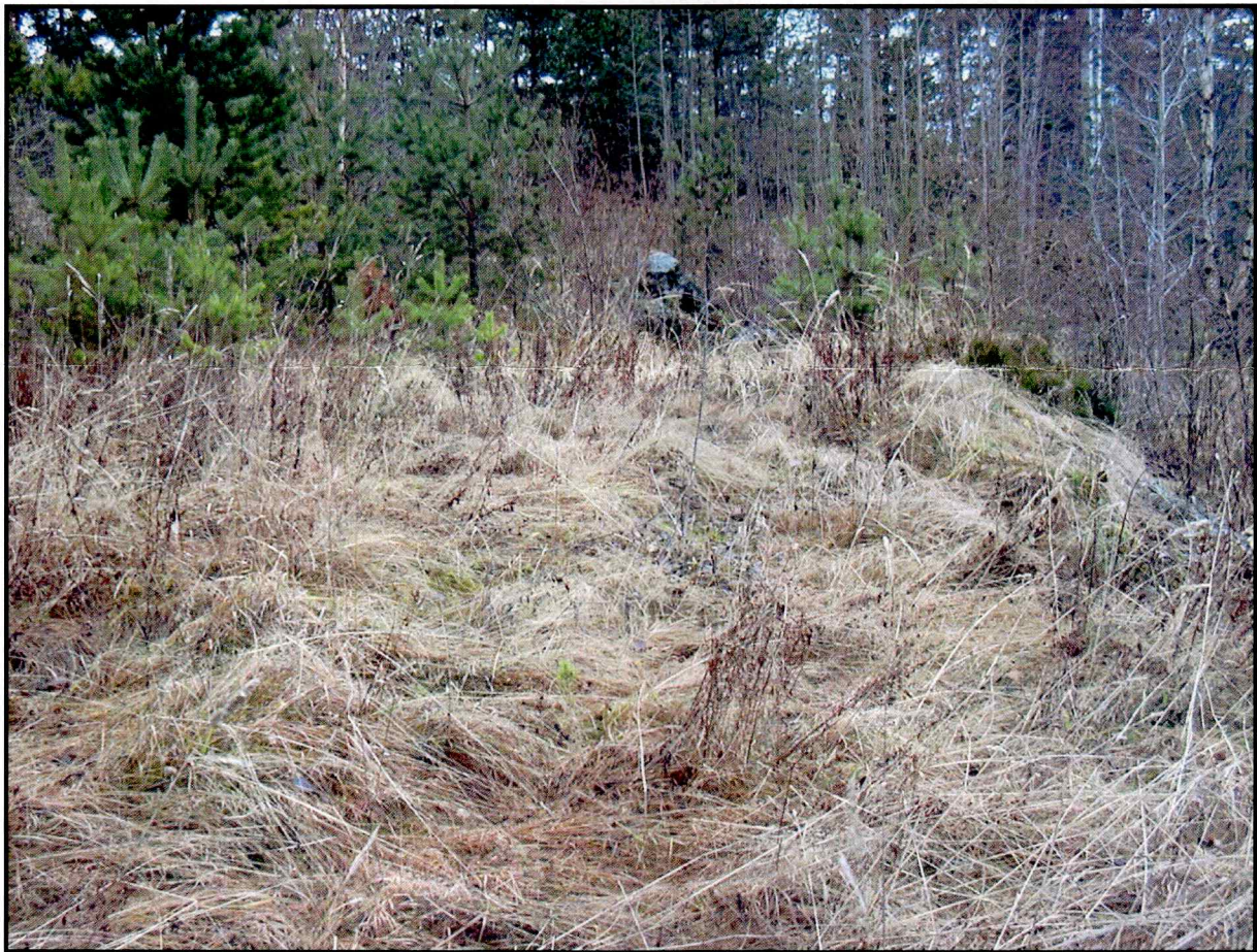
Dyrkningsterrasse i den vestre delen av planområdet.

Rydningsrøysene og dyrkningsterrassene har etter all sannsynlighet sammenheng med løkkedriften på Kongsberg fra sølvverkstiden.