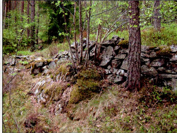
Et av mange steingjerder i trassen.