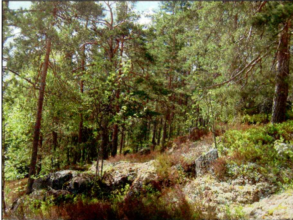
Eksempel på berglendt terreng.

Planområdet består i all hovedsak av berg og berglendt terreng som danner flere terrasser på østsiden av Feldberederåsen. Det finnes mindre partier med noe jordmonn og vegetasjon. Dette ligger imidlertid like over berg. Langs planlagt veitrasse finnes det også flere steingjerder og 3 mindre steinsetninger til buer av nyere tid.