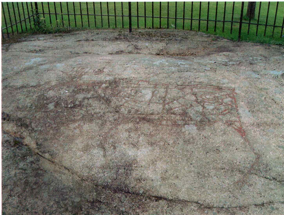
Bilde av helleristningsfeltet lok.42863, tatt mot Ø.

Det var på forhånd kjent automatisk fredete kulturminner rett utenfor planområdet. Det ene er et helleristningsfelt lok.42863. Feltet består av tre figurer, en dyrefigur, trolig en elg, en trekantet figur og en fuglefigur. Dette feltet ligger ca 125 m VSV for SV hjørnet av hovedbygningen på gården. Ca 200 m SV for helleristningsfeltet skal det også være funnet ei øks (lok.13189).