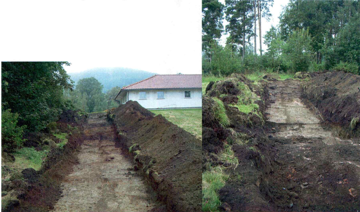
Bilder fra sjakta som ble gravd.

Innenfor planområdet var det en del isskurte berg helt i dagen, som ikke blir direkte berørt av utbyggingen. Disse bergene ble allikevel undersøkt, uten at det ble funnet helleristninger på dem. Enkelte av bergene var også en del forvitret.