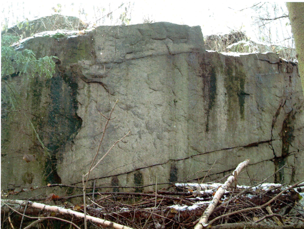
Bergflater med potensial for bergkunst (mot SV)