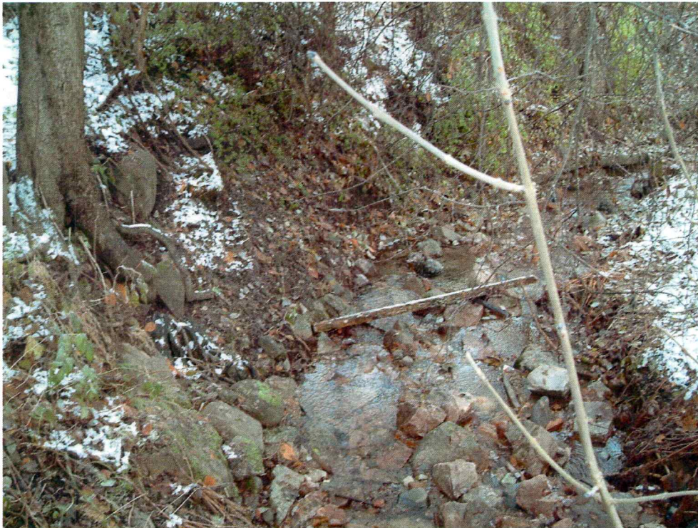
Bekkefar i den østre delen av planområdet (mot N)

Bergflatene ble nøye sondert etter bergkunst. Bergarten var noe grov, men enkelte flater synes å ha vært gunstige. Det ble imidlertid ikke påvist noen form for bergkunst.