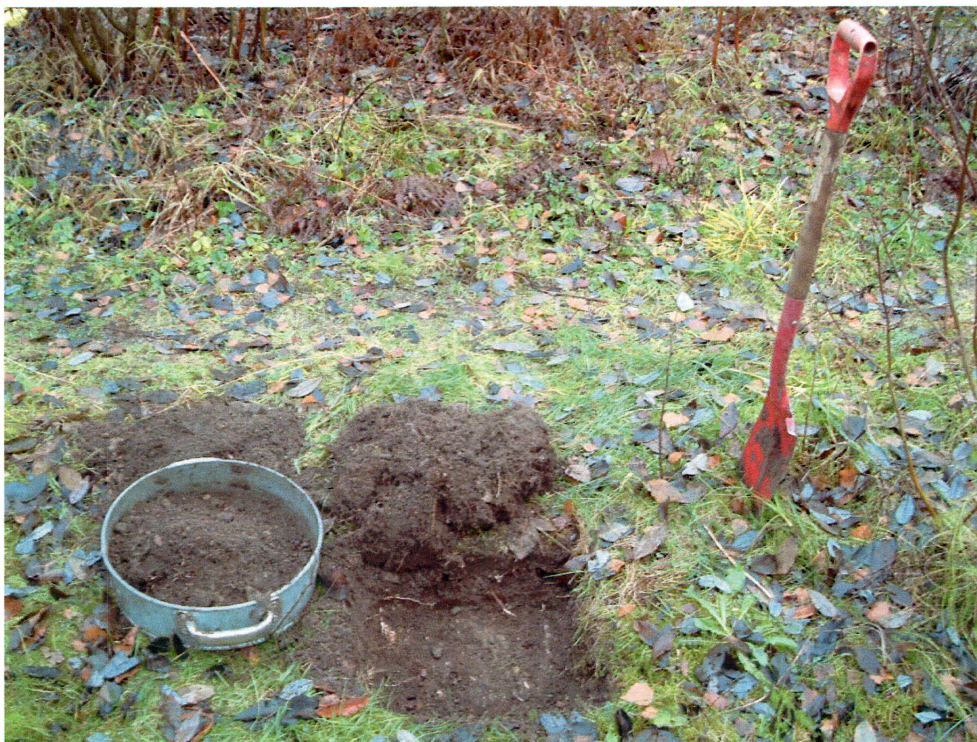
Prøvestikk i den sørlige delen av planområdet (mot NNØ)