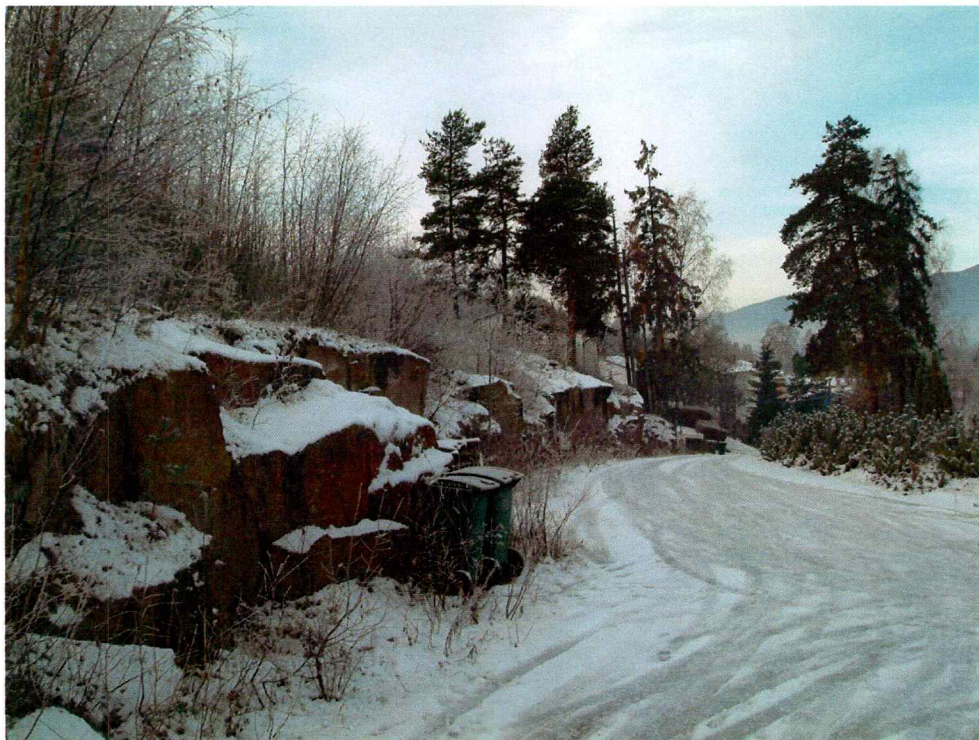
Vestre del av planområdet (mot VNV)

Planen omfatter et område med skog og tettbebyggelse i området Skogli/Kikkut på sørsiden av Drammenselva i Drammen kommune. Planområdet målte i den opphavlige planen 12,75 dekar, men etter utvidelsen er dette økt til nærmere 20 daa.