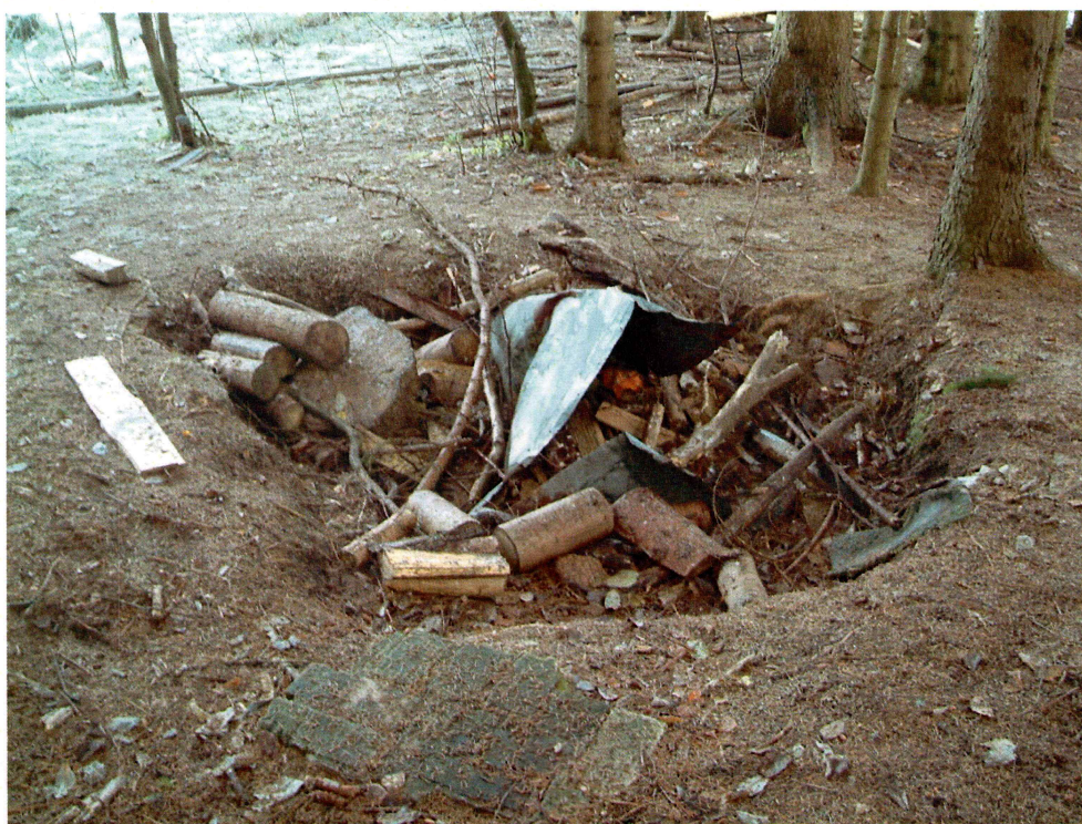
Moderne grop (mot NNØ)

Området ble innledningsvis overflateregistrert for å påvise automatisk fredete kulturminner.