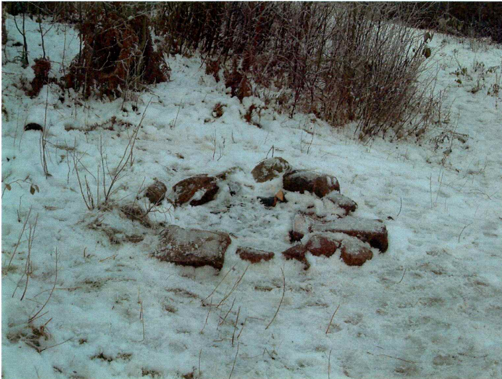
Bål plass (mot NV)

I tillegg til kjerneområdet som er avsatt til boligbygging og friluftsområde, omfatter planene tre mindre armer mot nord og vest som er planlagt til kjøreveier og turstier. Områdene har til nå vært mye benyttet til lek og friluft, og det går også en større sti gjennom området.