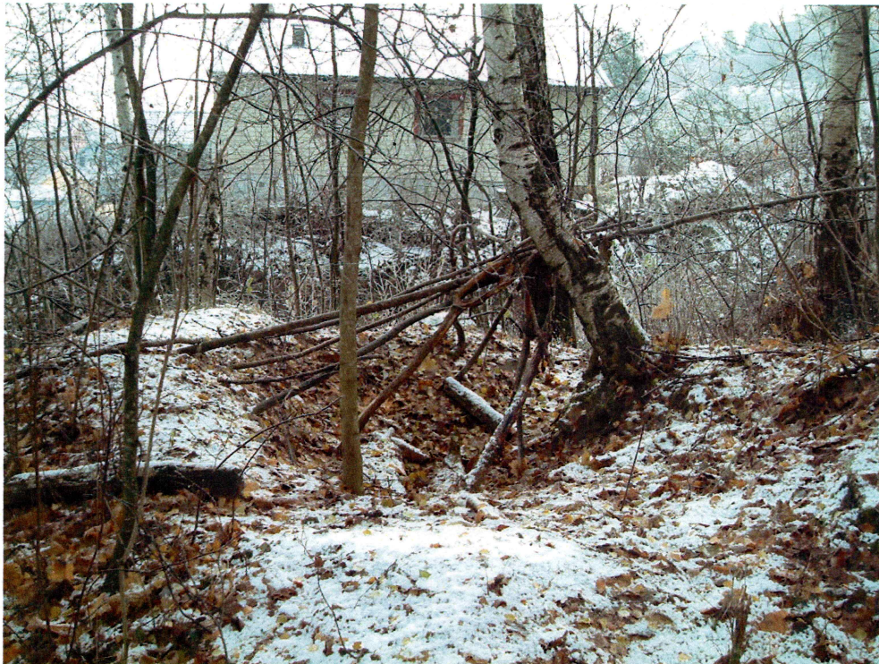
Moderne grop (mot ØSØ)

Det ble funnet en del groper. Enkelte av disse synes å være naturlige og skapt av underliggende bergformasjoner, men to av gropene var menneskeskapt. Disse synes begge å være moderne.