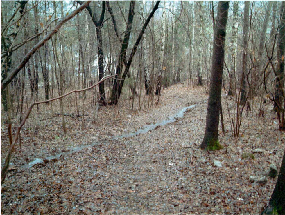
Vegetasjon i planområdet (mot NØ)